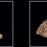
Vasenringe 235 – 239