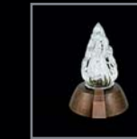
Elek. Laternen 227