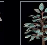
Bäume 483 – 490