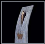
Stelen 376 – 380