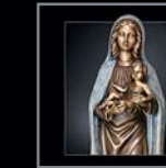
Madonnen mit Kind 308 – 314