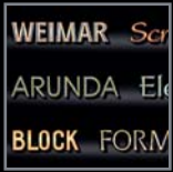
Schriften (Einzelbuchst.) 3 – 98

Gestaltungsmappe Nr. 80 (Stand: 1. Oktober 2011). Bitte klicken Sie auf das gewünschte Kapitel . . .