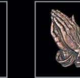
Betende Hände 444