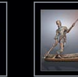
Symbole 401 – 445