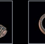
Zierringe Rosetten 445