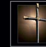
Kreuze 382 – 400