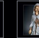
Madonnen 315 – 319