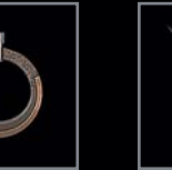
Erinnerungs- elemente 446 – 448