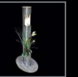
Ritualelemente (klappbar) 302 – 305