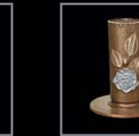
Versenkvasen 231 – 235