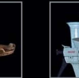
Zubehör 263 – 288