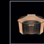
Weihwasser- schalen 256 – 259