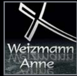
Schriftzüge aus Edelstahl / Bronze 126 – 148