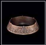
Pflanzringe 254 – 255