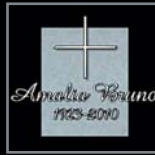
Schriftzüge aus Alu / Bronze 148 A – 148 H