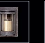
Ritualsäulen 297 – 300