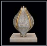
Knospe (drehbar) 306