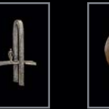
Figürliche Darstellungen 413 – 424