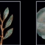
Blätter 493 – 494