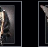
Engel 325 – 336