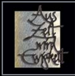
Schriftzüge aus Bronze/Alu 104 – 124