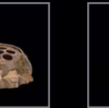
Vasen 239 – 242