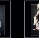
Trauernde 320 – 324