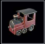
Symbole für Kindergräber 435 – 438