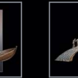
Brücken Regenbögen 402 – 412