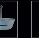
Einbau- kombinationen 290 – 296