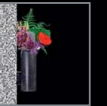
Schalen 247 – 253