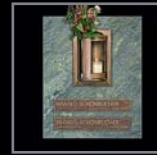
Beschriftung von Natursteinplatten 162 – 166