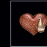
Herzen 442 – 443