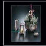
Garnituren 168 – 215