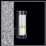
Wandlaternen 225 – 227