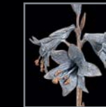
Blumen 477 – 482