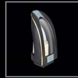
Laternen 216 – 224