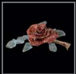
Rosen 466 – 476