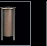
Wandvasen 243 – 246